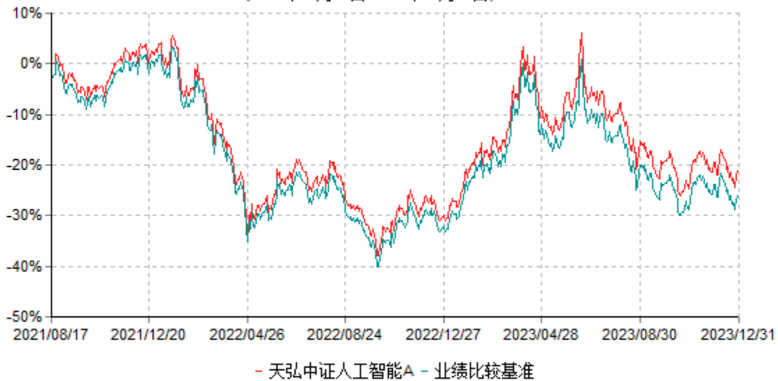
天弘中证人工智能A累计净值增长率与业绩比较基准收益率历史走势对比图 (2021年08月17日-2023年12月31日)