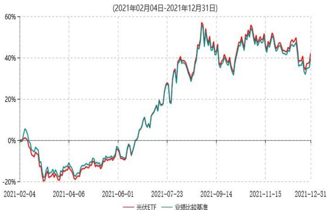
天弘中证光伏产业交易型开放式指数证券投资基金累计净值增长率与业绩比较基准收益率历史走势对比图