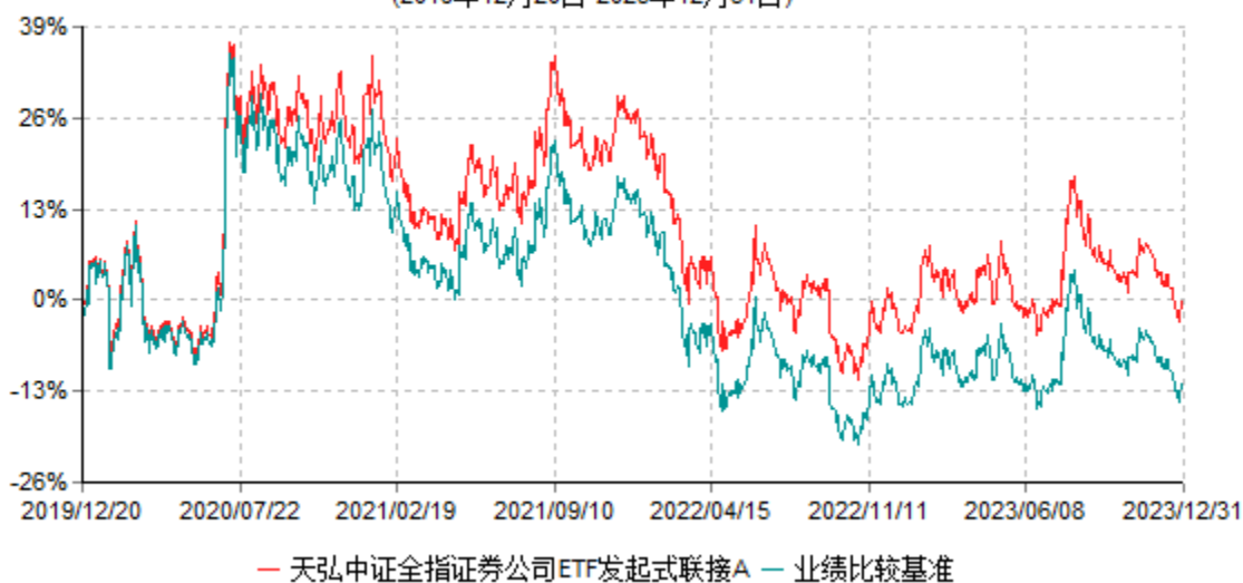
天弘中证全指证券公司ETF发起式联接A累计净值增长率与业绩比较基准收益率历史走势对比图 (2019年12月20日-2023年12月31日)