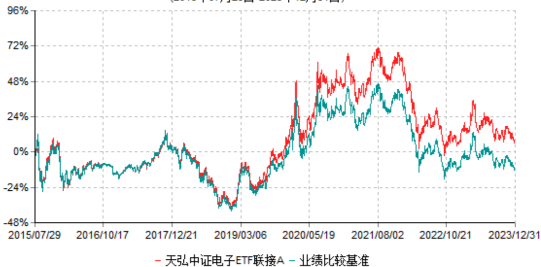
天弘中证电子ETF联接A累计净值增长率与业绩比较基准收益率历史走势对比图 (2015年07月29日-2023年12月31日)