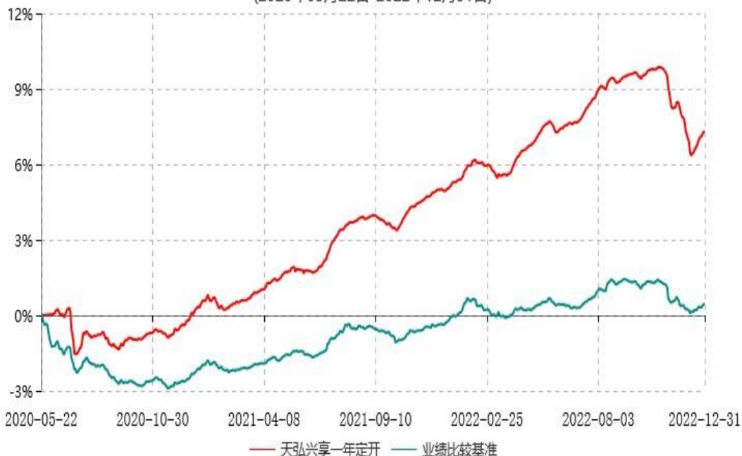
天弘兴享一年定期开放债券型发起式证券投资基金累计净值增长率与业绩比较基准收益率历史走势对比图 (2020年05月22日-2022年12月31日)