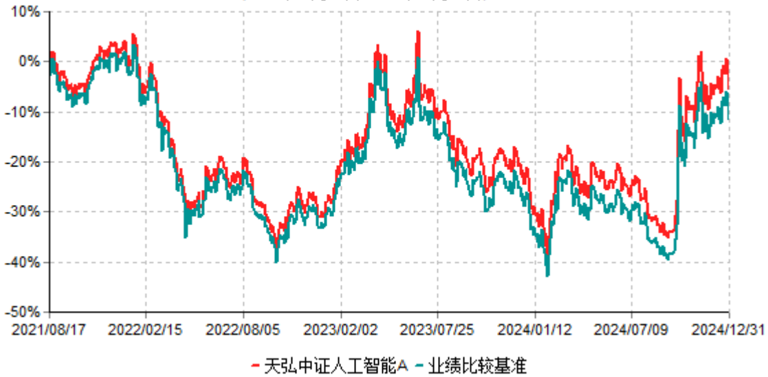
天弘中证人工智能A累计净值增长率与业绩比较基准收益率历史走势对比图 (2021年08月17日-2024年12月31日)