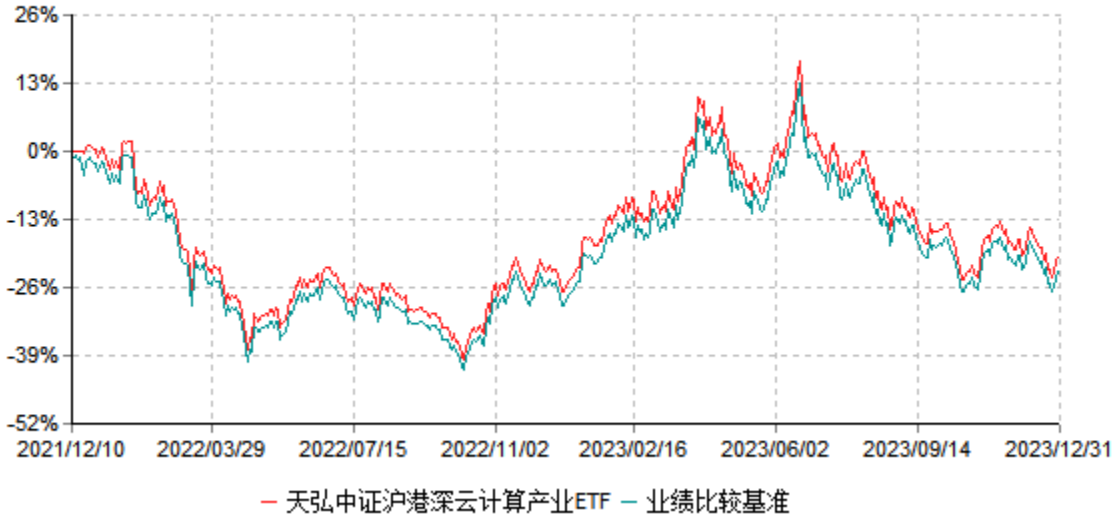
天弘中证沪港深云计算产业交易型开放式指数证券投资基金累计净值增长率与业绩比较基准 收益率历史走势对比图 (2021年12月10日-2023年12月31日)

注：1、本基金合同于2021年12月10日生效。 2、本报告期内，本基金的各项投资比例达到基金合同约定的各项比例要求。