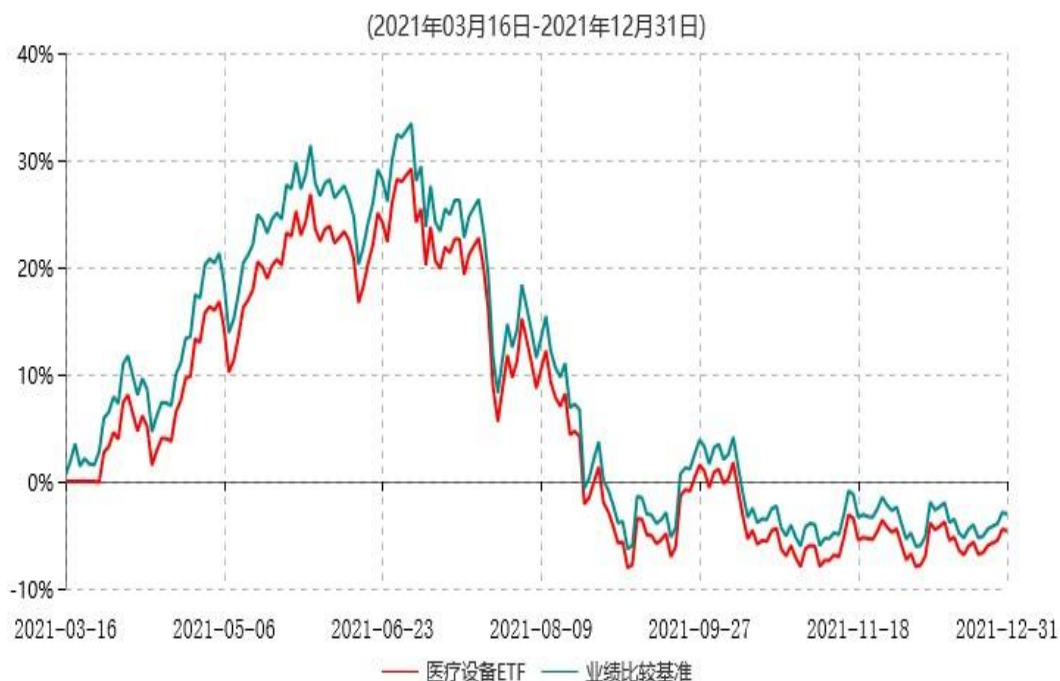
天弘中证全指医疗保健设备与服务交易型开放式指数证券投资基金累计净值增长率与业绩比较基准收益率历史走势对比图