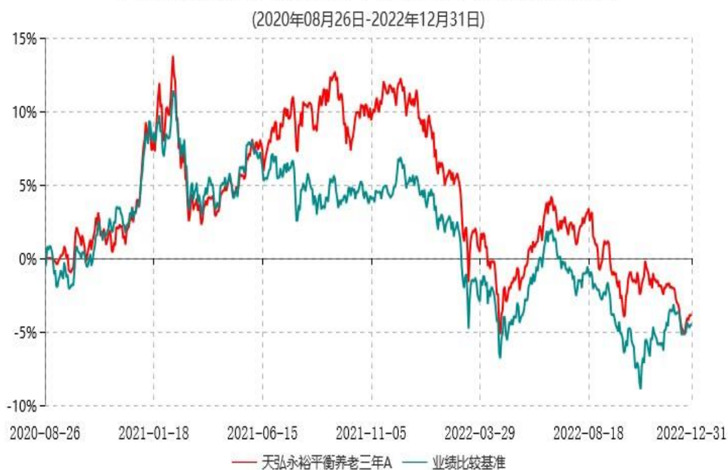
天弘永裕平衡养老三年A累计净值增长率与业绩比较基准收益率历史走势对比图