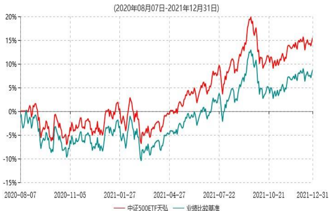
天弘中证500交易型开放式指数证券投资基金累计净值增长率与业绩比较基准收益率历史走势对比图