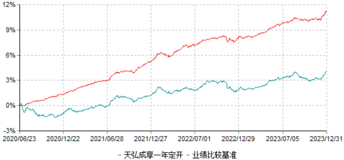
天弘成享一年定期开放债券型证券投资基金累计净值增长率与业绩比较基准收益率历史走势对比图 (2020年06月23日-2023年12月31日)