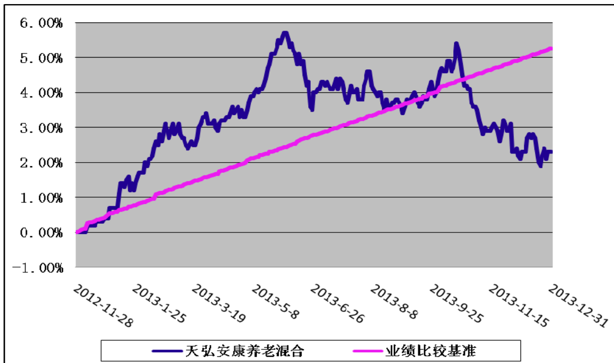
天弘安康养老混合型证券投资基金 份额累计净值增长率与业绩比较基准收益率历史走势对比图 (2012年11月28日-2013年12月31日)