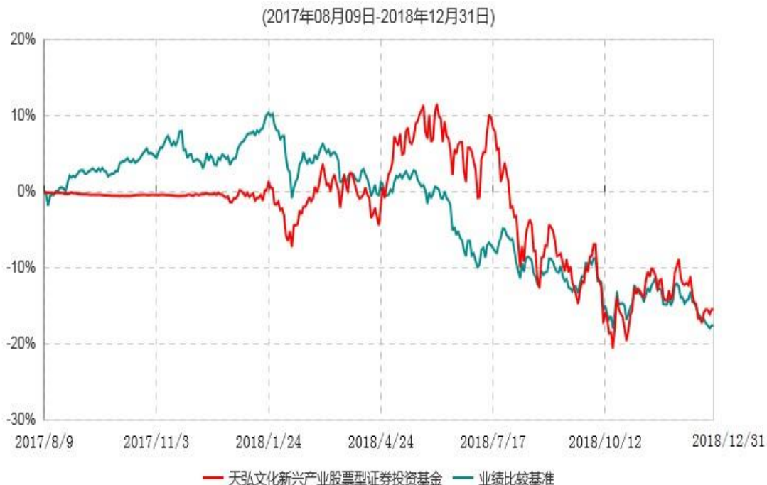
天弘文化新兴产业股票型证券投资基金累计净值增长率与业绩比较基准收益率历史走势对比图

注：1、本基金合同于2017年08月09日生效，本基金于2017年08月09日由天弘鑫动力灵活配置混合型证券投资基金转型而成，名称相应变更为“天弘文化新兴产业股票型证券投资基金”。