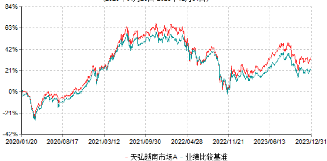
天弘越南市场A累计净值增长率与业绩比较基准收益率历史走势对比图 (2020年01月20日-2023年12月31日)