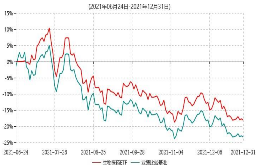
天弘国证生物医药交易型开放式指数证券投资基金累计净值增长率与业绩比较基准收益率历史走势对比图

注：1、本基金合同于2021年06月24日生效，本基金合同生效起至披露时点不满1年。