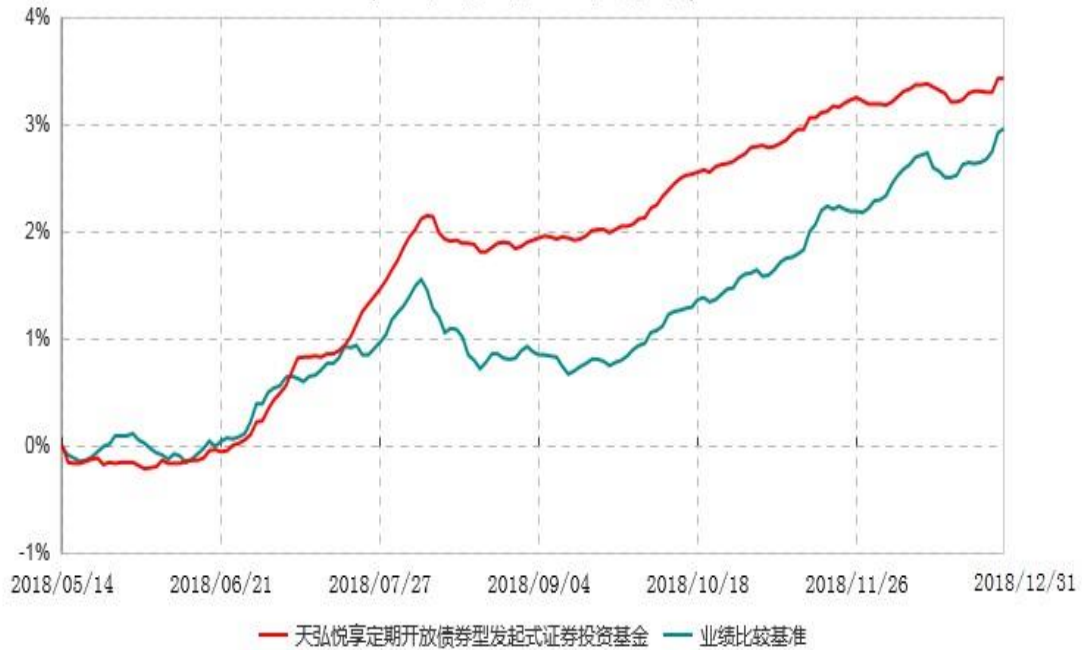
天弘悦享定期开放债券型发起式证券投资基金累计净值增长率与业绩比较基准收益率历史走势对比图 (2018年05月14日-2018年12月31日)

注：1、本基金合同于2018年05月14日生效，本基金合同生效起至披露时点不满1年。 2、按照本基金合同的约定，基金管理人应当自基金合同生效之日起6个月内使基金的投资组合比例符合基金合同的有关约定。本基金的建仓期为2018年05月14日至2018年11月13日，建仓期结束时及至报告期末，各项资产配置比例均符合基金合同的约定。