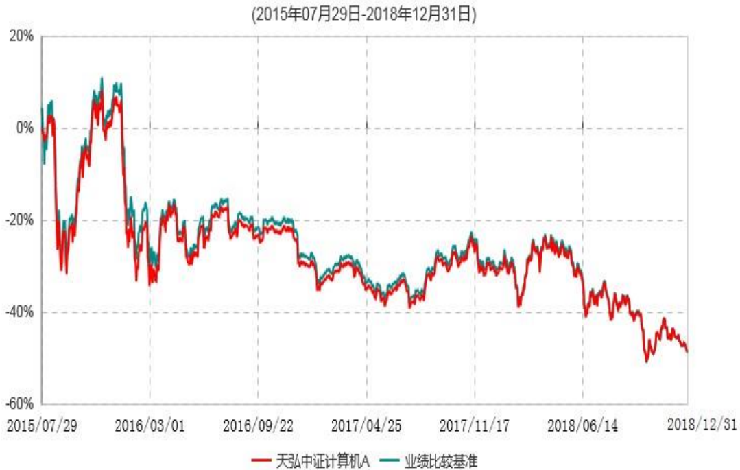
天弘中证计算机A累计净值增长率与业绩比较基准收益率历史走势对比图