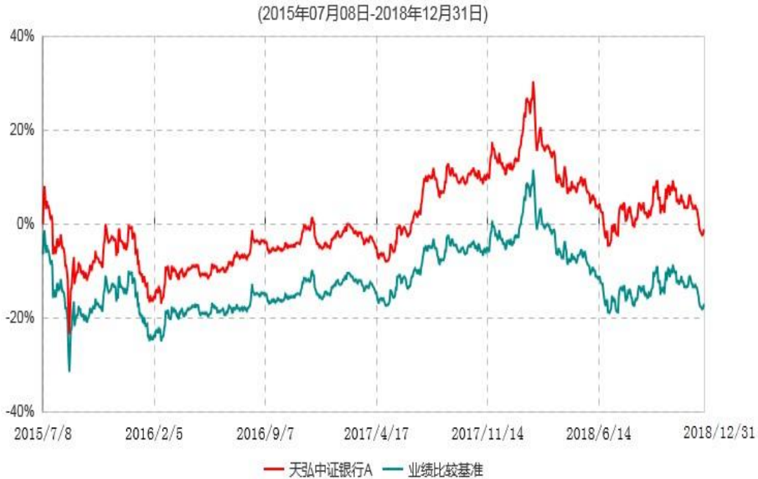
天弘中证银行A累计净值增长率与业绩比较基准收益率历史走势对比图