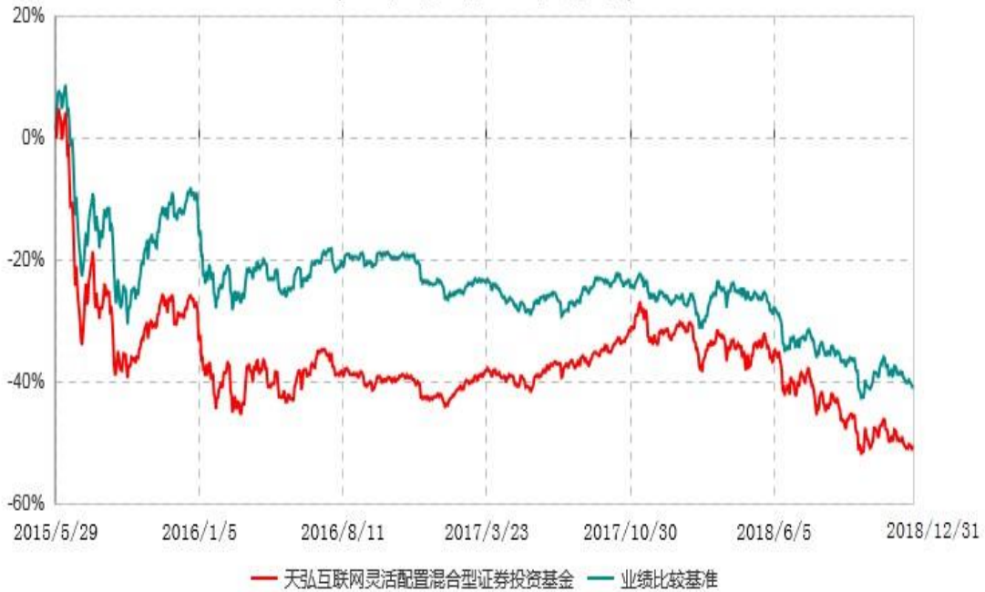
天弘互联网灵活配置混合型证券投资基金累计净值增长率与业绩比较基准收益率历史走势对比图 (2015年05月29日-2018年12月31日)