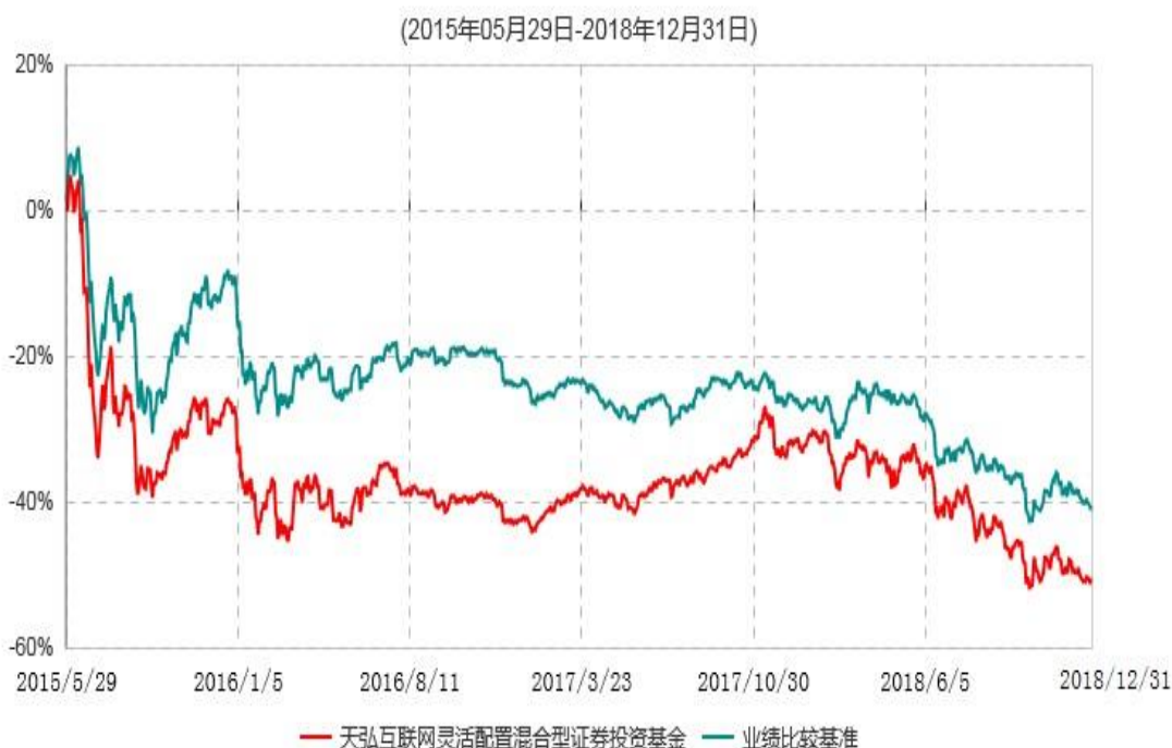
天弘互联网灵活配置混合型证券投资基金累计净值增长率与业绩比较基准收益率历史走势对比图